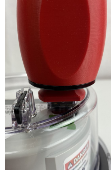
Cat. 1041-CN con Cat. 1039-WP