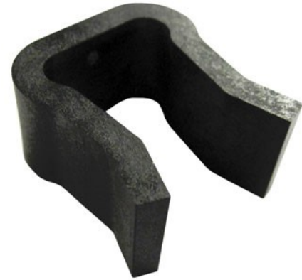
CLIP DE SEGURIDAD DE ENCHUFE CATALOGO NO. 301